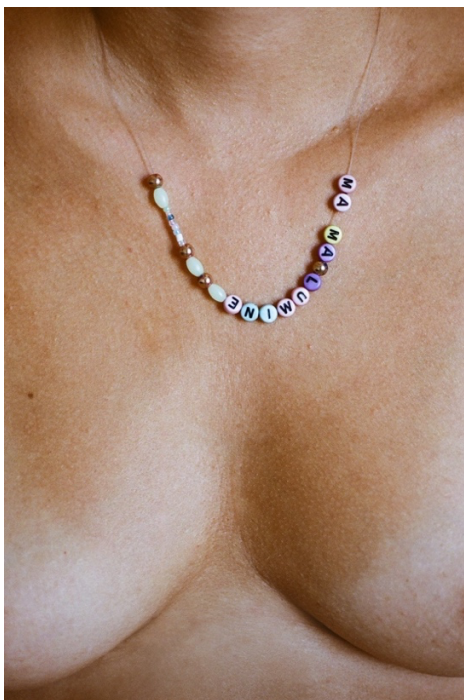
Slika 14. Pukanić, Sara, Ogrlica , iz serije (Auto)portret ljubavi , 2023.