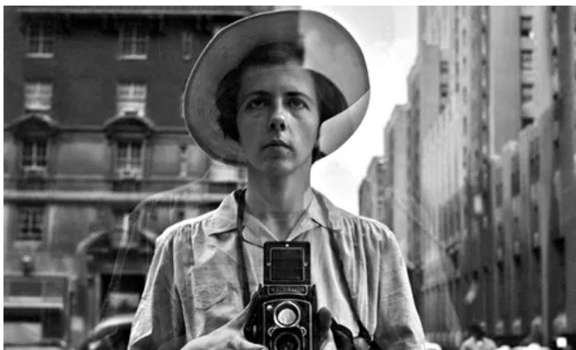
Slika 29. Maier, Vivian, Self-portrait , nepoznata godina

New Yorka (slika 29.) . Fotografija odraza u staklu je nejasna i замуćena, kao odraz na površini vode, pa pojačava dojam nestabilnosti, kratkotrajnosti i krhkosti uhvaćenog prikaza. Maier često snima u hodu, za vrijeme šetnje gradom pa se radi o fotografijama snimljenima iz ruke što često utječe na oštrinu fotografije.