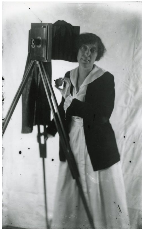
Slika 27. Matthews, Kate, Self-portrait with Camera , 1900.

paletu bilo lakše i diskretnije uklopiti u prikaz te se moglo jednostavnije s njom rukovati zbog njene veličine, fotografski aparat na stativu predstavljao je izazov za fotografe i fotografkinje koji su željeli autoportret vezati uz svoju profesiju. Takvo uklapanje fotografskog aparata u autoportretni prikaz predstavljalo je veći izazov za fotografkinje, koje su morale pronaći način kako vizualno prikazati svoj odnos prema umjetničkom alatu koji je najčešće bio i veći od njih samih. Zbog kontrasta između veličine kamere i visine fotografkinje, autoportreti fotografkinja s aparatom davali su prikazanim ženama veći dojam moći i kontrole. 75