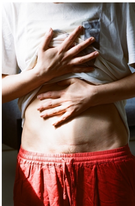
Slika 15. Pukanić, Sara, Ožiljak , iz serije (Auto)portret ljubavi , 2023.