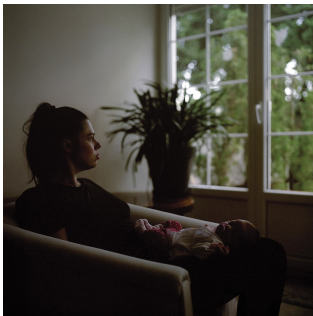
Slika 20. Blagović, Jelena, fotografija iz serije Nove samoće , 2020.

fotografija može se referirati, tematski i vizualno, na fotografsku seriju Nove samoće hrvatske fotografkinje Jelene Blagović. 55 Blagović na svojim fotografijama postavlja subjekte u interijere njihovih kućanstava (slika 20.) – spavaće sobe, dnevne boravke i kuhinje. Majke, u društvu svoje djece, uhvaćene su u sjedećem položaju, pogleda kojeg odvrćaju od kamere i usmjeravaju prema izvoru prirodnog svjetla – prozoru. Subjekti ne ulaze u komunikaciju s fotografkinjom niti se uključuju u interakciju s djecom, djeluju melankolično, odsutno i zaokupljeno mislima. Difuznim svjetlom i kontrastima svjetla i sjene autorica prikazuje svoje subjekte kao sjene, na pojedinim fotografijama naznačeni su samo obrisi figure. Na taj način autorica uspijeva prikazati subjekte u nadrealnoj i mračnoj atmosferi, izolirane i odvojene od stvarnosti. Na fotografiji Maja u dnevnom boravku pozicionirala sam subjekte unutar fotografije na isti način kao i Blagović – u interijeru kućanstva, sjedećem položaju pored izvora svjetla i bez interakcije s aparatom ili međusobno. Na taj način željela sam majčinstvo prikazati i kao iskustvo koje može biti složeno i izolirajuće, a dom kao mjesto samoće i neizvjesnosti.