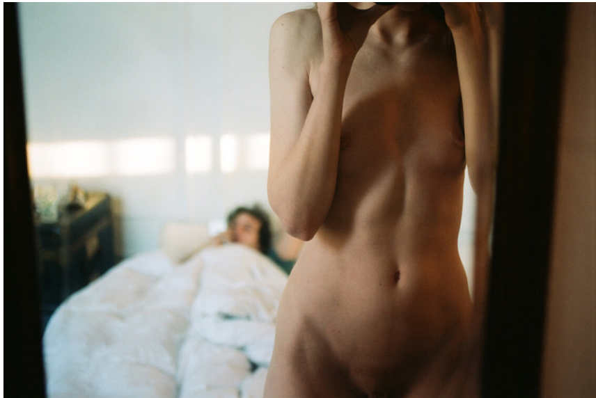
Slika 23. Scheynius, Lina, fotografija iz serije Diary 2015

Druga fotografija na koju se referiram je fotografija Andresa Madera Selbstoprat mit Ilse und Udo iz 2017. godine (slika 24.), koja je dio njegove serije Die Tage Das Leben , a radi se o jedinom autoportretu u seriji, odnosno fotografiji na kojoj se Mader pojavljuje u društvu dvoje prijatelja. Sva tri subjekta nalaze se u eksterijeru parka na klupi, sjedeći vrlo blizu jedan drugome. U sredini, između Madera i njegovog prijatelja Ude, nalazi se Ilse.