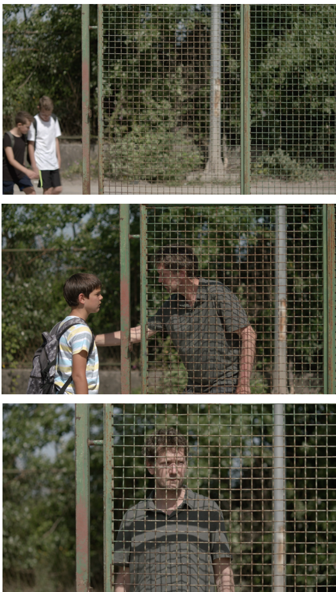
Slika 17: Isječak iz filma „Mali Libero“

Za iduću smo scenu znali da je želimo snimiti u jednom neprekinutom kadru. Trenutak je to kada otac i sin prilaze igralištu, te se otac obraća sinu zadnjim riječima podrške prije utakmice - ili barem tako on to doživljava. Ujedno, to je privremena točka rastanka sina i oca na njihovom zajedničkom putovanju, a i prvi put da sin naglim odlaskom pokazuje jasan otpor prema očevim riječima. Sporom, jedva primjetnom vožnjom unaprijed, prešli smo iz dvoplana oca i sina u bliski plan oca koji na trenutak promatra sina pri odlasku. Ogradom smo se poslužili kao simboličkom barijerom između oca i sina, smještajući jednog od njih na prazan dio lijevo od žice, a drugog iza nje. Vizualno, to jasno predstavlja unutrašnji sukob koji se odvija između njih te najavljuje ono što će se dogoditi na kraju filma – osamostaljenje dječaka od pretjerano ambicioznog roditelja.