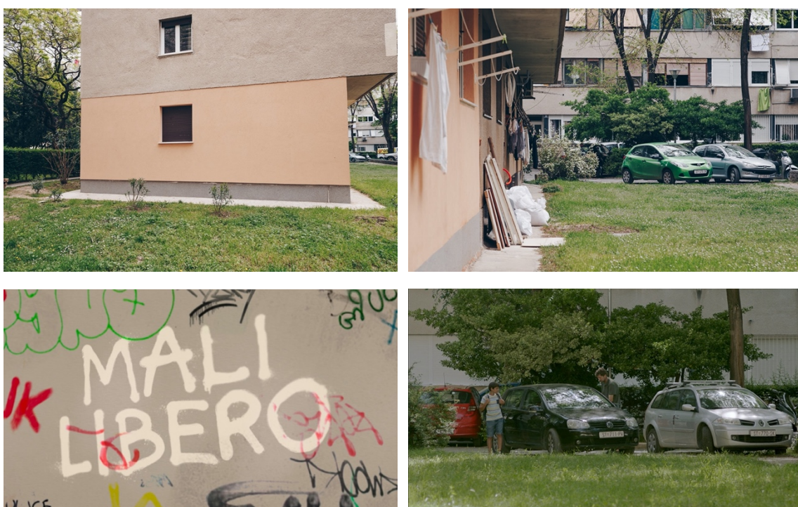
Slika 1: Usporedba lokacije parkirališta, isječak iz filma

Parkiralište zgrade smo tražili imajući na umu željeno otvaranje filma. Ideja je bila da sporijom vožnjom preko čiste fasade zgrade otvorimo pogled na parkiralište u trenutku u kojem Boško zaustavlja auto, te on i Petar izlaze iz istoga. Čista fasada bila nam je bitna kako bi se u postprodukciji omogućilo dodavanje naslova filma.