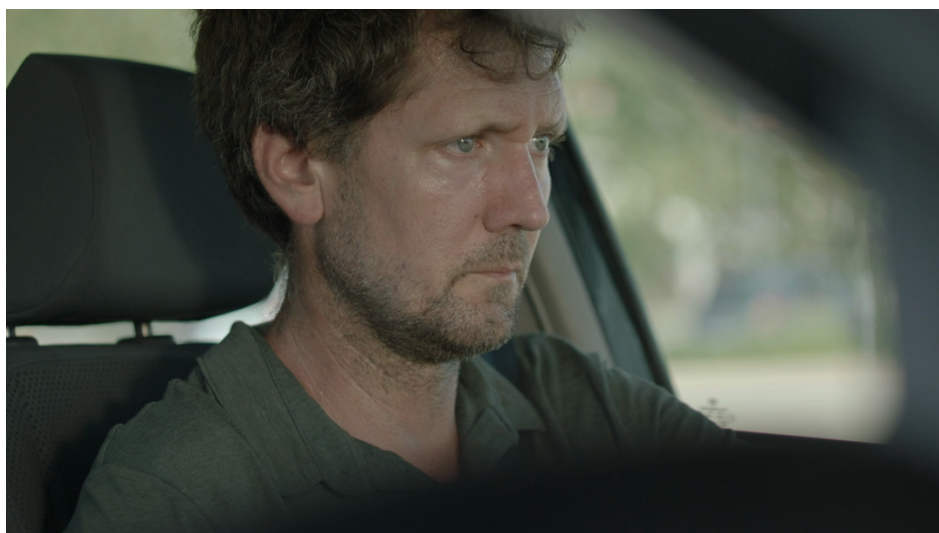
Slika 16: Fotografija sa snimanja - postav rasvjete; kadrovi iz filma „Mali Libero“