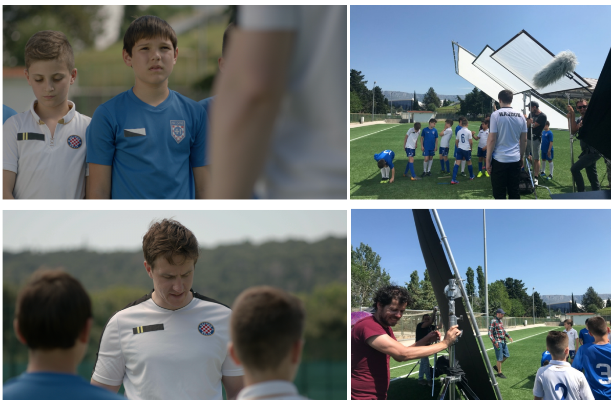
Slika 14: Usporedba, fotografije postava svjetla sa snimanja, kadrovi iz filma „Mali Libero“

Ono što me tokom cijelog perioda priprema zabrinjavalo bili su vremenski uvjeti i kako zadržati kontinuitet izgleda filmske slike tokom pet snimajućih dana u kojima se oslanjamo na Sunce kao izvor svjetla. Imali smo sreće, te nas je vrijeme zaista poslužilo. Po planiranom, u dispozicije smo stavili snimanje širih planova čim ranije ili kasnije u danu, dok smo bliže planove snimali dok je Sunce bilo visoko. Kod bližih planova smo koristili difuzne materijale na okvirima - 251 difuzu - kako bi omeškali svjetlo koje pada na lica protagonista, dok smo upotrebom negera kontrolirali kontrast. U nekim situacijama, kada bi osjetila da su pak sjene prejake, koristili bi reflektirajuće površine – stiropor 2x1m bijelo/srebro ili stiropor 1x1m bijelo/srebro kako bismo ih ublažili reflektiranjem svjetla.