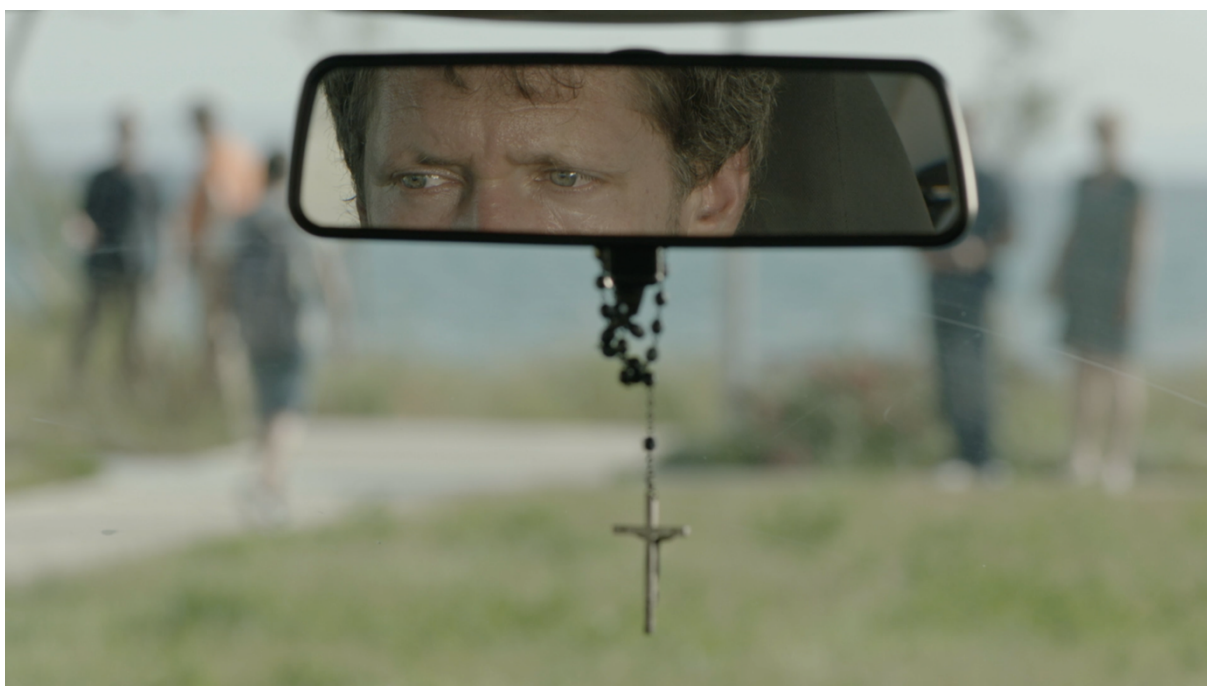
Slika 13: Kadar iz filma „Mali Libero“

prvi put pojavljuju u filmu, ipak sam odabrala drukčiju opciju. Odlučila sam se vizualno zadržati u unutrašnjosti automobila i samim tim, podcrtati unutrašnji sukob koji se očitava u očima oca koji promatra sina pri odlasku. Prvotna ideja je bila snimiti kadar u kojem je oštrina u potpunosti na majci i očuhu, dok se otac vidi u neoštrom foreplanu slike. U jednoj repetitiji se oštrina trebala prebaciti s njih na oca kao uobičajeni primjer uspostave odnosa izoštravanjem suprotstavljenih strana. Ipak, od obje ideje smo na kraju odustali kada smo shvatili da se cijela scena odvija iz fokalizacije oca koji se konačno slama pod navalom emocija. Iako bi prvotno zamišljeni pristup sceni bio klasičniji i na jedan način sigurniji, on bi odvlačio pozornost sa prijelomnog trenutka u filmu koji je izrazito važan za shvaćanje Boškovog karaktera. Naime, to je prvi i jedini put da spomenuti lik jasno pokazuje ranjivost od koje potječu frustracije koje je do tada nenamjerno iskaljivao na vlastitom djetetu. To nije trenutak u kojem isključivo publici to postaje jasno, već i samom glavnom liku. Zbog toga sam osjetila potrebu da se u tom trenutku vizualno zadržim na njemu. Uz prethodnu suglasnost redatelja, takvim rješenjem sam pokušala utjecati na atmosferu scene i stvoriti vizualno emocionalan trenutak koji smatram bitnim za razumijevanje glavnog lika, a samim tim, u konačnici i filma.