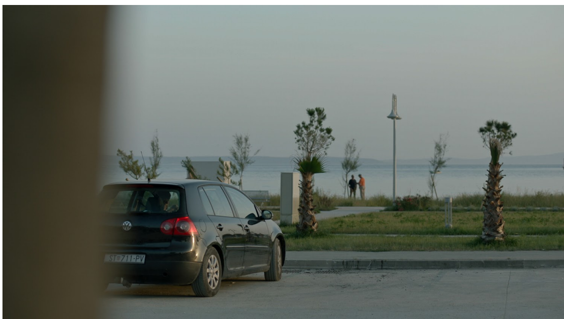
Slika 5: Usporedba lokacije parkirališta, isječak iz filma