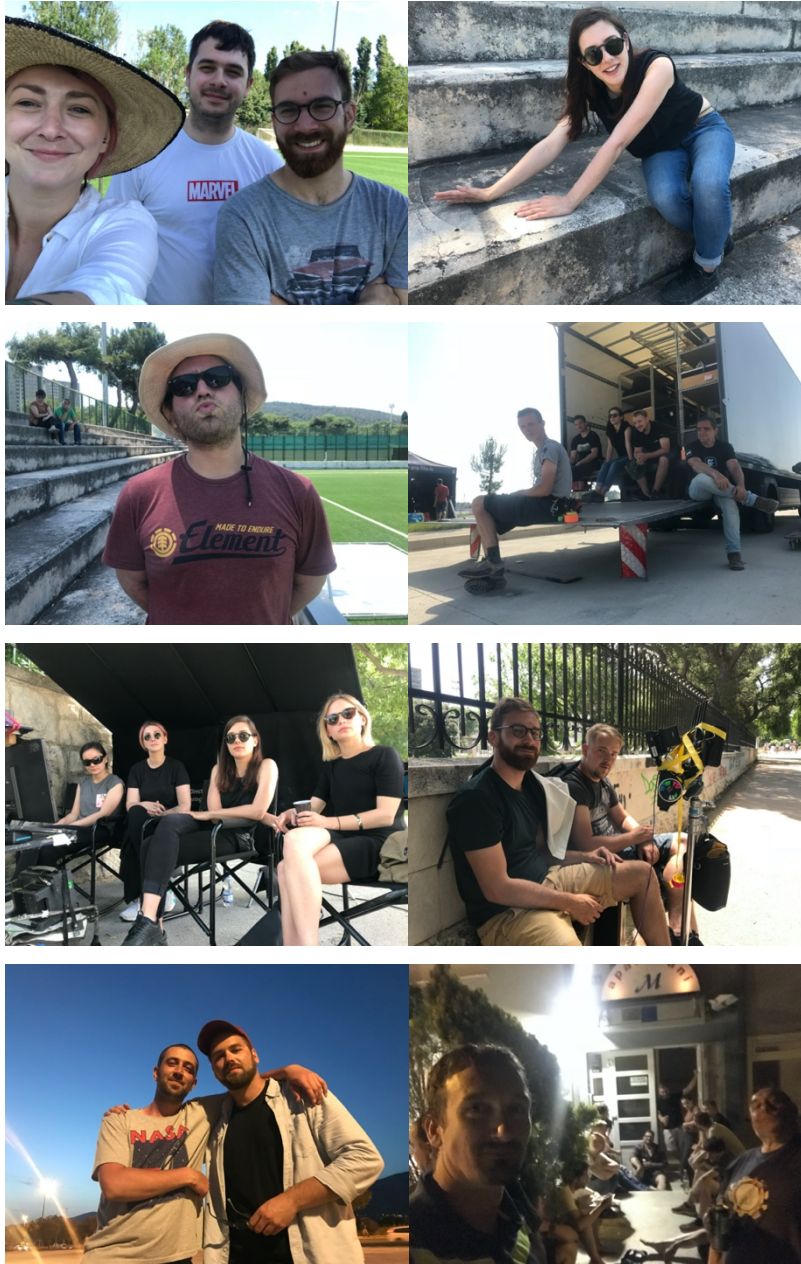
Slika 23: Ekipa filma „Mali Libero“