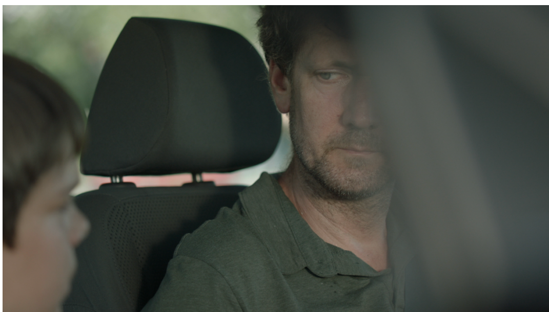
Slika 12: Kadar iz filma „Mali Libero“, krupni kadar Boška preko otvorenih vratiju automobila

Često se vizualna rješenja ponude i tokom samog snimanja. Tako je i bilo u zadnjoj sceni, kada Petar otvara vrata kako bi izišao iz parkiranoog automobila. Snimali smo krupni kadar Boška, preko Petrovog prozora. Kada je Petar otvorio vrata u prvoj repetitiji, potpuno je prekrivio Boškovo lice. Naizgled greška, potencijalno odličan dramaturški trenutak. Predložila sam redatelju da dopustimo pogrešku, ali namjestimo vrata tako da prekriju otprilike polovicu lica. Ovo je ipak trenutak u filmu u kojem otac shvaća da mu sin odrasta i u njemu se lome dvije strane – ostati takav kakav je, ili se možda probati promijeniti za dobrobit odnosa.