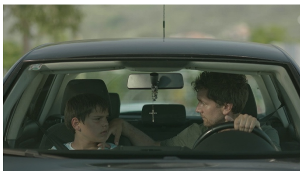
Slika 6: Usporedba planiranog kadra iz knjige snimanja, isječak iz filma