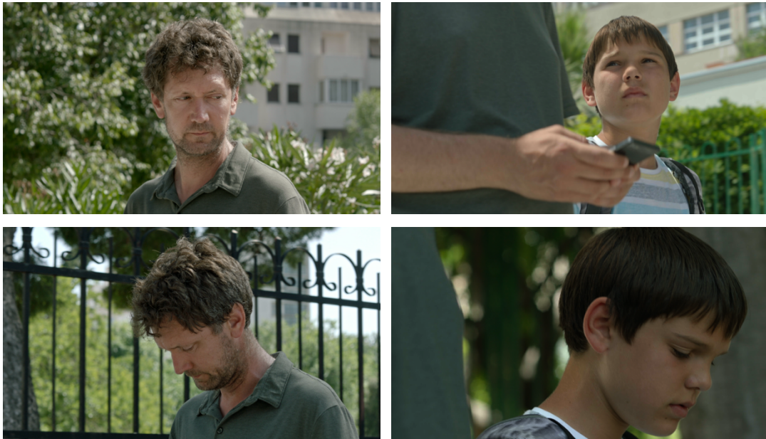
Slika 15: Usporedba, glavni likovi pod direktnim suncem, te u hladu drveća, kadrovi iz filma „Mali Libero“

U zadnjoj sceni odlučila sam se na korištenje rasvjetnog tijela ARRI M18. Naime, na lokaciju smo imali pristup od 11.30 sati, kada je već Sunce bilo visoko, te smo planirali snimanje do 19 sati, kada se sunce spušta. Po scenariju, ova se scena odvija kasnije popodne, dok je Sunce već niže. Kako su nam likovi cijelo vrijeme unutar auta, odlučila sam u početku pomoću rasvjete kreirati svjetlo koje će se spuštanjem Sunca kroz sate snimanja i dogoditi i ugođajem odgovarati dobu dana po scenariju. Na ovaj sam način održala svjetlosni kontinuitet unutar scene.