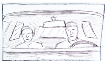
E5 - POLUBLIZU, DVOPLAN - kontinuitet - stativ

OPIS KADRA: Dvoplan. Otac i sin su automobilu, pričaju.