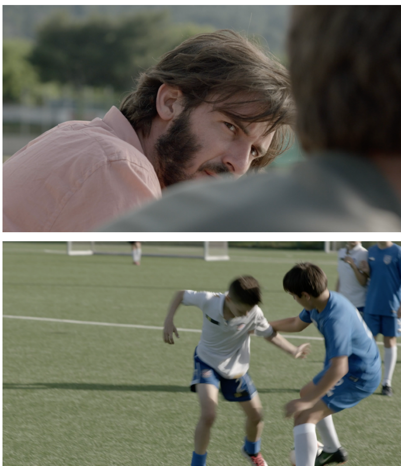
Slika 19: Isječci iz filma „Mali Libero“

Do promjene u tom pristupu dolazi u trenu kada Boško glasno opomene Lukina sina s tribine. Luka mu to zamjeri, te podigne glas na njega. U tom trenutku uvodimo kadrove snimljene sa slidera . Preko ramena jednog roditelja snimamo lice drugog roditelja i obrnuto. Time dodatno naglašavamo sukob koji se događa između njih dvojice. U tom trenutku uvodimo i igru na terenu koju snimam s kamerom iz ruke, bez upotrebe stabilizatora, kako bi dobili na dinamici. U montaži su ovi kadrovi spojeni kako bi podcrtali simboliku prijenosa sukoba očeva na njihovu djecu.