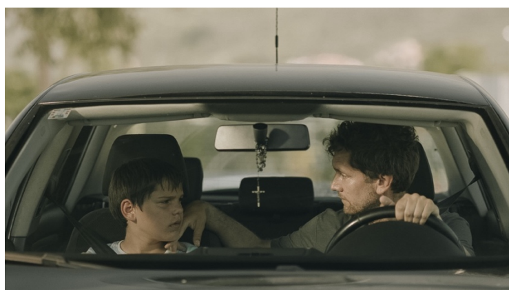
Slika 21: Usporedba trenutnog izgleda obrade slike te idejnih skica za završnu obradu izgleda slike kratkometražnog filma „Mali Libero“