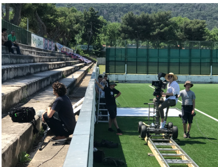
Slika 18: Fotografije sa snimanja filma „Mali Libero“, postavljanje i korištenje tračnica