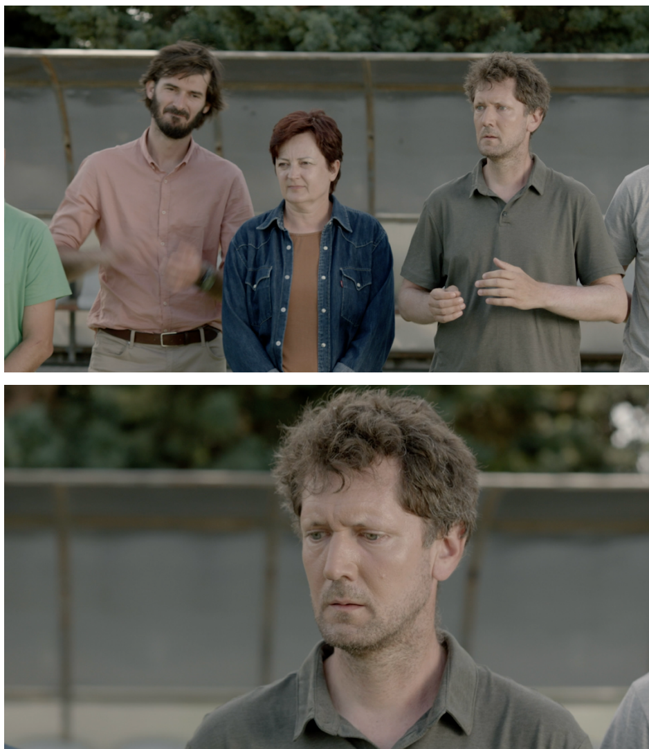
Slika 20: Usporedba kadra sa početne i završne pozicije kamere, isječci iz filma „Mali Libero“

Boškovom licu. Tempo ove vožnje ujedno je i najbrži u filmu. Željeli smo podcrtati osjećaj naleta emocija, svima nam poznat iz vlastitih života, koji je ponekad nalik šamaru. Dramaturški je to trenutak u kojem se Bošku ruši svijet i ovakav pokret kamere to dodatno naglašava.