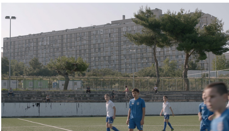
Slika 4: Usporedba lokacije terena Poljudu, isječak iz filma