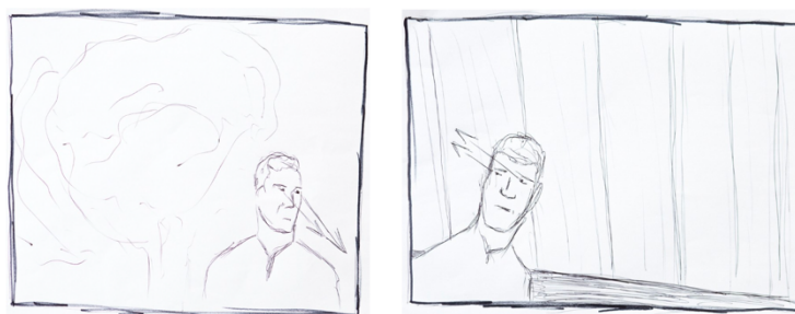
Slika 7: Skice planiranih kompozicija kadrova

Često se događa da nakon čitanja scenarija vizualno zamislim film na određen način, koji zatim uz predloške iz likovne umjetnosti ili sačuvanim fotografijama iz raznih filmova ili televizijskih serija predstavim redatelju s kojim surađujem. U ovom sam slučaju, na temelju narušenog odnosa između oca i sina, predložila korištenje dekompozicije – postavljanja likova na rubove kadra. Takvu kompoziciju slike sve češće vidamo u novijim televizijskim i filmskim produkcijama. Mišljenja sam kako svako vizualno odstupanje – bilo u postavu rasvjete, kadriranju ili pak pokretima kamere– treba imati svoje zašto. Čini mi se kako se ponekad takvi izmaci pojavljuju samo zato jer su vizualno atraktivni, te često odvlače pozornost umjesto da pomognu ispričati priču. U našem slučaju, u ovoj ranoj fazi, redatelju se takav pristup činio zanimljiv te smo ga odlučili uključiti u knjigu snimanja.