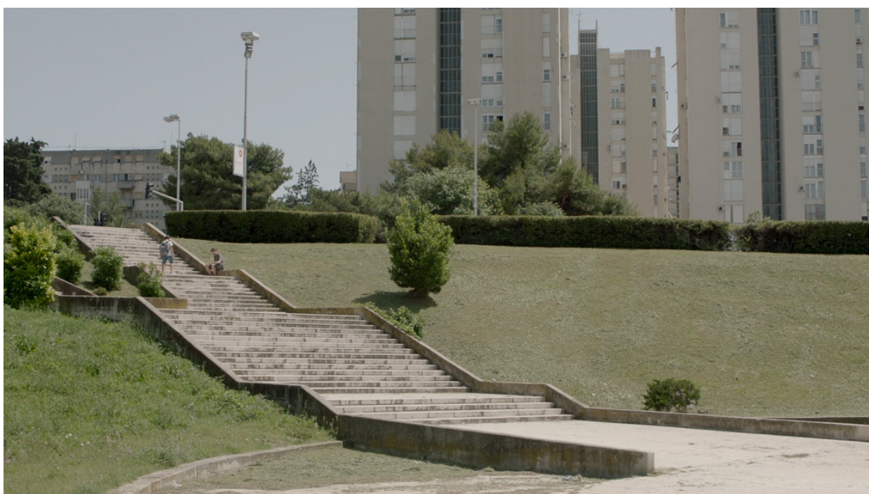
Slika 3: Usporedba lokacije prilaza Poljuda, isječak iz filma