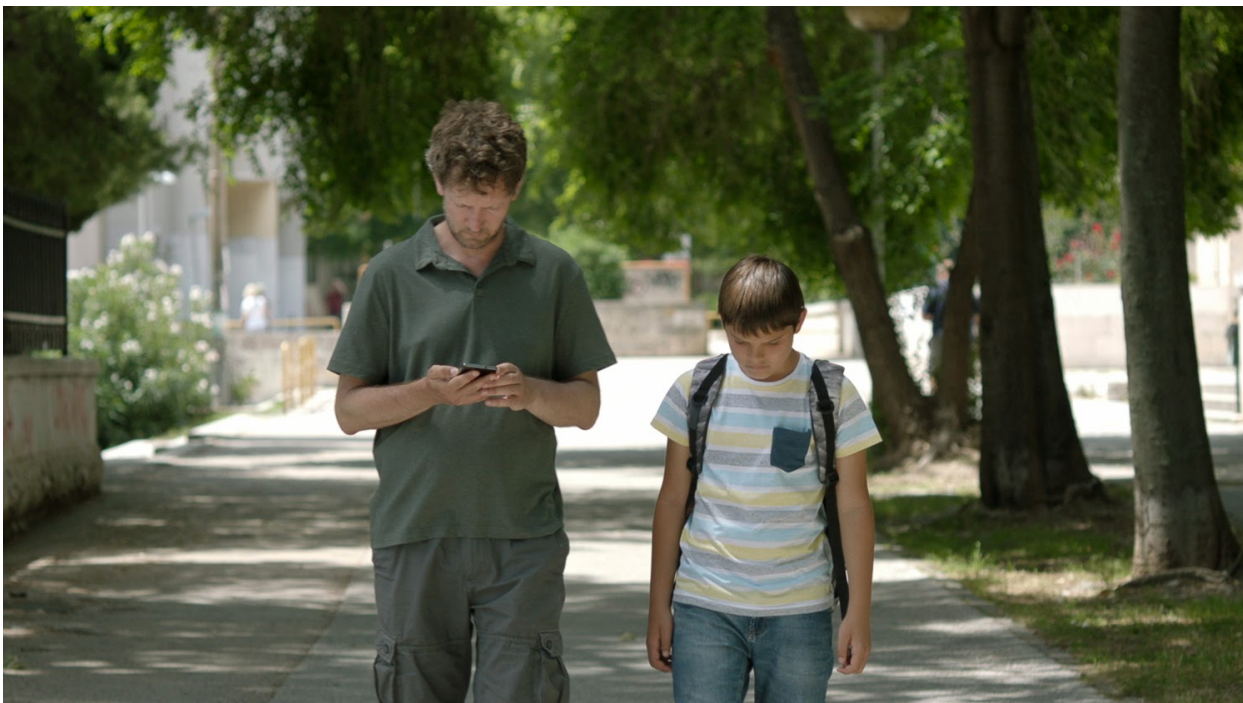
Slika 2: Usporedba lokacije šetnice, isječak iz filma