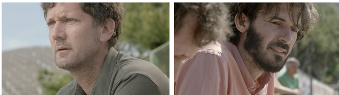
Slika 22: Isječci iz kratkometražnog filma „Mali Libero“

Ako se ne bavimo dalje tim pitanjima, ostaje nam trenutna verzija obrade slike. Uočavam mjesta u filmu u kojima na snimanju, ali ni u postprodukciji nisam uspjela održati kontinuitet. Za primjer ću uzeti scenu s nogometnih tribina, konkretno krupne kadrove očeva - Boška i Luke.