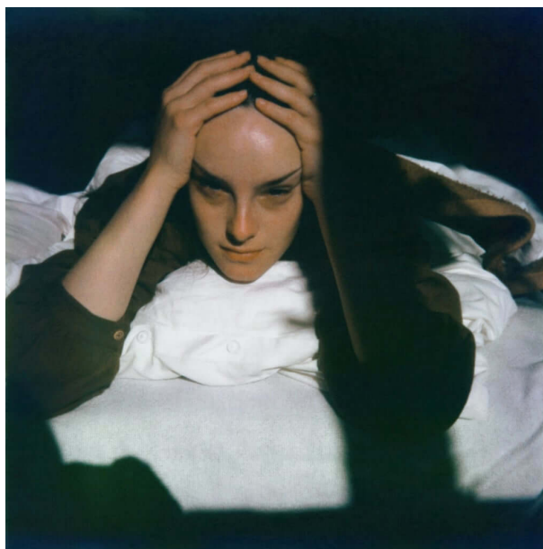
Slika 4. Furuya, Seiichi, Graz 1979. , iz serije Portrait 1979. , 20

Seiichi Furuya je japansko-europski fotograf rođen u Japanu 1950. godine. Nakon završenog fakulteta preselio se u Austriju, gdje u Grazu osniva fotografski časopis Camera Austria . U Grazu 1978. godine upoznaje svoju buduću ženu Christine, koja je glavna inspiracija i tema njegovih fotografskih radova. Furuya i Christine proveli su zajedno osam godina, sve do 1985. godine kada je počinila samoubojstvo. Nakon njezine smrti, Furuya je počeo pregledavati svoj fotografsku arhivu te stvarati fotografske knjige pod imenom Memoires . Do 2020. godine Furuya je objavio šest fotografskih knjiga – memoara – koji se sastoje većinom od portreta Christine (slika 4.).