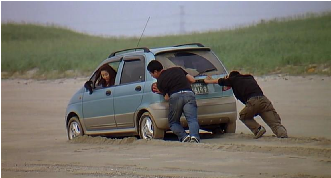
Slika 5. : Kraj filma Žena na plaži

Prvi put Hong se odlučio za diskretno „optimističan“ kraj. Kroz neznatnu gestu bezinteresne pomoći Moon-sook je možda samo na trenutak vidjela mogućnost, izlaz iz začaranog kruga besmislenih odnosa i prolaznih žudnji. Moon-sook je prvi (ženski) lik kojemu je u Hongovu filmskom svijetu ponuđena alternativa.