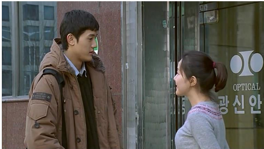
Slika 4.1. : „Filmski“ susret u filmu Priča o filmu

Kao i u tom filmu i „stvarni“ dio priče koristi zumove čime Hong implicitno poručuje da nema stvarne razlike između događaja u filmu i u stvarnosti. Međutim, ovaj stvarnosni dio nema izvanprizornu naraciju redatelja, osim na samome kraju. Iz kina izlazi redatelj Kim i primijeti glumicu Choi koja je igrala glavnu žensku ulogu u filmu u filmu. Redatelj tog, fikcijskog filma je teško bolestan i njegova obitelj organizira okupljanje radi financijske pomoći za njegovo liječenje. Kim sazna preko prijatelja za to okupljanje. Kim puši crveni Marlboro kao i glavni muški lik Jeon u fikcijskom filmu. Saznajemo da Kim i bolesni redatelj više nisu toliko bliski kao što su bili za vrijeme studija. Redatelj Kim ponovno slučajno nabasa na glumicu Choi ispred iste trgovine gdje su se susreli Choin fikcijski lik i student Jeon (u gotovo identičnom kadru). Kim joj kaže da je išao zajedno s bolesnim redateljem u filmsku školu. Pita je želi li glumiti u njegovom novom filmu i traži njenu adresu da joj pošalje scenarij. Choi odbije jer ga ne poznaje, no dolazi na okupljanje pa će tamo popričati.