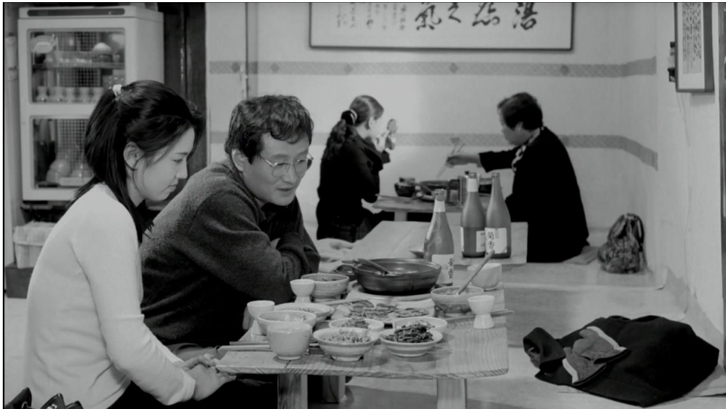
Slika 2.1. : Prva verzija scene u filmu Oh! Soo-jung