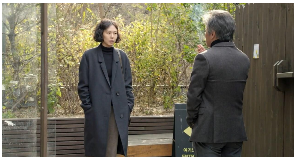
Slika 7.3. : Glavna junakinja Gam-hee s bivšim ljubavnikom u filmu Žena koja je bježala