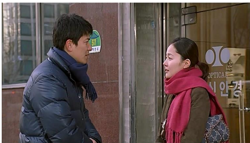
Slika 4.2. : „Stvarni“ susret u filmu Priča o filmu