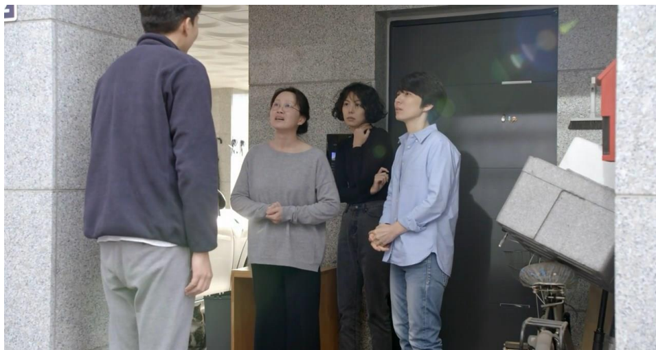
Slika 7.1. : Prvi muškarac u filmu Žena koja je bježala