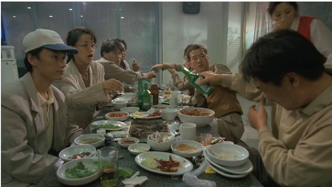
Slika 1. : Kadar-scena u filmu Dan kada je svinja pala u bunar

U ključnoj sceni prve priče, svjedočimo potpunom raspadu pišćeve kontrole. U restoranu, gdje se okupljaju izdavači, drugi pisci, kritičari, Hyo redom prvo pjeva karaoke, pjesmu o ljubavnom napuštanju, pijan u dva navrata nametljivo i napadno inzistira nudeći alkohol jednoj od žena (djevojci pisca koji je popularniji od njega, dakle u pitanju je stanovita latentna zavist), konobarica slučajno prospe hranu po Hyou, on zove Min koja se ne javi i onda se krene svađati s konobaricom jer se ne ponaša „kako treba“, iako se ispričala. Svađa preraste u otvoreni sukob i vrijeđanje konobarice, što još dodatno eskalira kada ga gomila ljudi izbaci, a on potpuno „poludi“, rušeći stvari i razbivši bocu, spreman za nasilje. Ovakvo gomilanje društveno „sramotnih“ situacija nesumnjivo ima apsurdan, čak i komičan učinak, međutim sve ostaje na razini karakterizacije: Hyo, pogotovo u stresnim situacijama, jednostavno ne može i ne želi kontrolirati vlastite impulse.