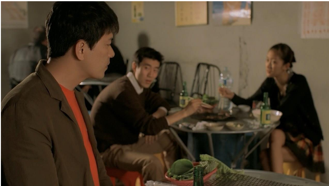
Slika 3. : Društveno neugodna situacija u filmu Okretna ulazna vrata

neku drugu? Je li pomislio da je to Seon? Izostanak subjektivnog kadra i kadra reakcije pojačavaju dojam ambivalentnosti i dvosmislenosti.