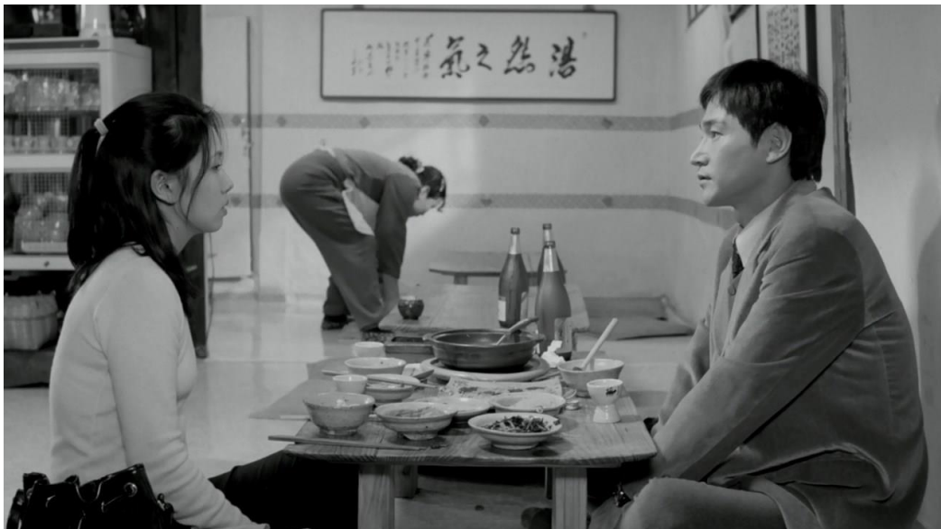
Slika 2.2. : Druga verzija scene u filmu Oh! Soo-jung

U prvoj verziji priči, vlasnik galerije isprva neuspješno pokušava „zavesti“ Soo, no ona naposljetku popusti. Indikativna je scena kad se njih dvoje voze u autu, a vlasnik se hvali pokretnim krovom, dok Soo priča o svom djetinjstvu. Vlasnik je baš i ne sluša, a kada Soo završi, zavlada neugodna atmosfera. Ali zato on „blista“ od zadovoljstva u hotelu kada mu ona priopći da je djeвица (a nakon njegova „navaljivanja“ da spavaju zajedno). Nakon kratkotrajnog prekida i svađe (u kojoj je Jae rekao da je čak razmišljao i o braku s njom i da želi da njihov odnos ima „smisla“), javlja se još jedna scena pokušaja seksa u hotelskoj sobi. Jae je sada frustriran njenim odbijanjem u toj mjeri da zahtijeva da mu „pokaže“ svoju menstruaciju ne bi li se uvjerio govori li Soo istinu. Soo ga smiri govoreći mu da želi spavati s