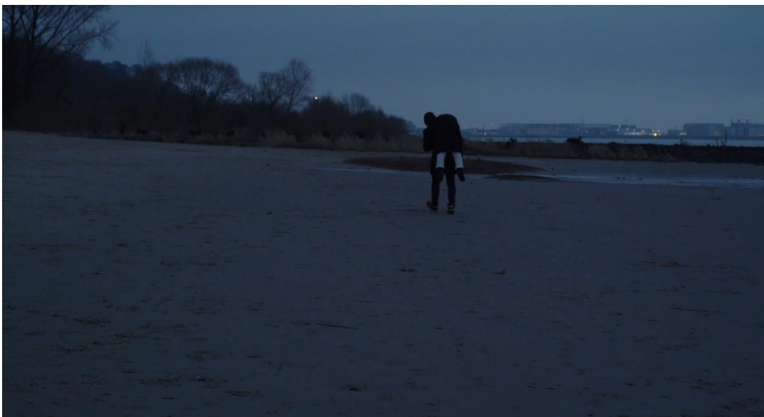
Slika 6.1. : Zamišljanje otmice na kraju prvog segmenta u filmu Sama na plaži noću

Stranac probudi Young-hee na plaži jer se zabrinuo da tu spava. Young-hee se zahvali i hoda na plaži, u sličnom kadru kao na kraju prvog dijela filma, ali ovaj put je sama, nitko je ne nosi. Također, stranac više nije potencijalna prijateljica, već netko sposoban za gestu suosjećanja, što pak ima paralele s krajem filma Žena na plaži . Young-hee je izgleda u snu „riješila“ svoj problem s redateljem, teret koji je nosila tijekom trajanja radnje filma.