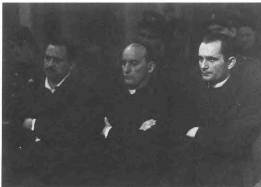
Slika 1 - Optuženi u filmu Stepinac pred narodnim sudom (1947.) Fedora Hanžekovića 1

U doba nove jugoslavenske kinematografije 40-ih godina, od ukupno 33 proizvedena filma, u Hrvatskoj je proizvedeno osam filmova. Vrijeme je to kada filmska proizvodnja nije bila ni velika ni raznolika, a s obzirom na to da tada igranih filmova nije bilo, najčešća forma bili su kratkometražni dokumentarni filmovi. Film je prvenstveno bio politička stvar, a naglasak je bio na tehničkom znanju snimatelja. Od otprilike 1947. do 1950. dolazi do procvata dokumentarnog filma te su se za njega tada odvajala i posebna sredstva. Narativno dokumentarni filmovi tog doba su bili međusobno slični, bez obzira na temu svaki od filmova bio je neki oblik filmskog žurnalizma. Iako su prve godine nove kinematografije bile razdoblje u kojem su prednjačili snimatelji poput Blažina, Akčića, Sarića i Ribarića, neki poznatih redatelja tog doba bili su Milan Katić, Kosta Hlavaty, Branko Marjanović i Fedor Handžeković, Škrabalo (1998:144-151).