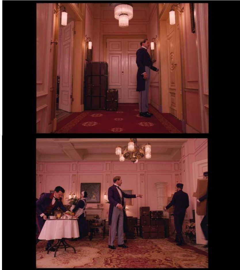
Slika 21 i 22: Kadrovi iz filma

gledatelju odmah postaje jasno da je on veoma organizirana i zapovjedna osoba, koja pomno isplanira svaku sitnicu i ništa ne prepušta slučaju (slika 21 i 22).