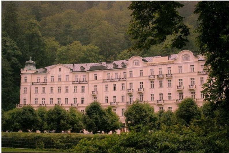
slika 5: Hotel Pupp

Jedna zlokobna scena, u kojoj zamjenik Kovacs bježi od svog napadača, snimana je u Zwinger muzeju u Dresdenu, bivšoj rokoko 8 palači koja je za potrebe filma pretvorena u Kunstmuseum. Među meni najupečatljivijim je i snježna planinska scena sa Zerom i Gustaveom, za čije je snimanje korišten minijturni model zgrade zvjezdarnice (slika 6), napravljen po uzoru na stvarni objekt - zvjezdarnicu Sfinga u Švicarskoj.