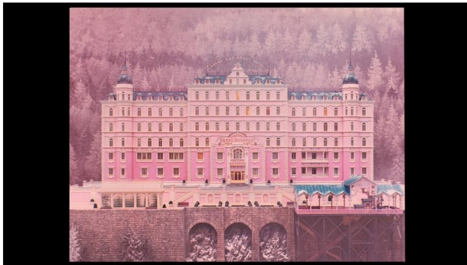
Slika 16: Kadar iz filma

Odmah na početku iduće scene dolazi do većih promjena u samoj slici. Format je sa dosadašnjih 1,85:1 iznenada promijenjen na 1,37:1, sugerirajući time neki drugi vremenski period (1930-e). Animirani kadar i Autorova naracija vodi nas preko malog gradića u Alpama, do vrlo poznatog hotela Grand Budapest u nekadašnjem svom živopisnom i kičastom, ali nadasve poštovanom izdanju (slika 16).