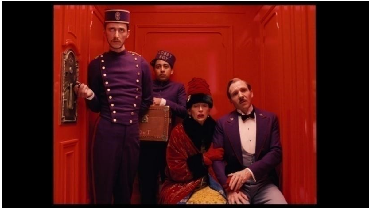
slika 26: Kadar iz filma

stila. Mnogi kadrovi u filmu ostavljaju znatan prostor iznad glave, kao što se i vidi u prijašnjim 1.37:1 primjerima. No, neki drugi kadrovi poput ovog u liftu (slika 26) pokazuju kako Anderson popunjava kadrove na različite i zanimljive načine.