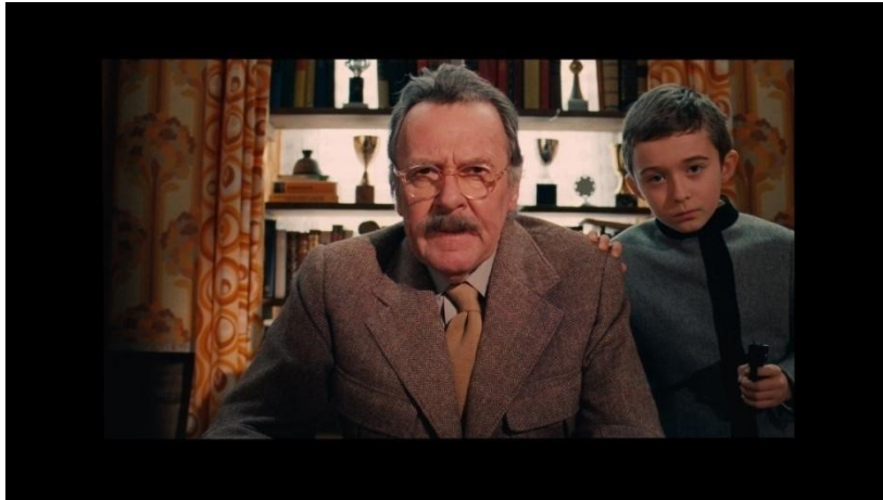
slika 15: Kadar iz filma

Odmah na početku iduće scene dolazi do većih promjena u samoj slici. Format je sa dosadašnjih 1,85:1 iznenada promijenjen na 1,37:1, sugerirajući time neki drugi vremenski period (1930-e). Animirani kadar i Autorova naracija vodi nas preko malog gradića u Alpama, do vrlo poznatog hotela Grand Budapest u nekadašnjem svom živopisnom i kičastom, ali nadasve poštovanom izdanju (slika 16).