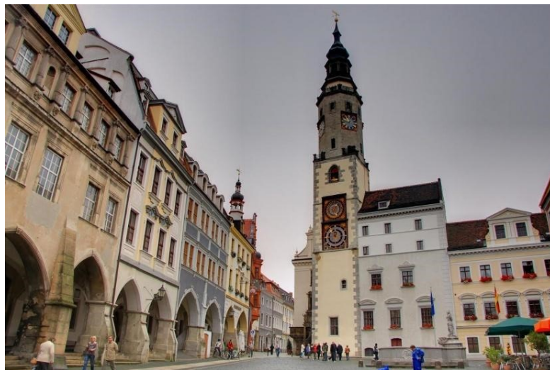
slika 4: Görlitz

Prvo, eksterijeri : Većina vanjskih scena u filmu snimljena je na krajnjem istoku Njemačke, te u javnosti nepoznatom gradiću Görlitzu (slika 4), koji je zbog jedinstvene povijesne arhitekture bio savršena lokacija za film. (I to ne samo za ovaj. Naišao sam na podatak da je samo u posljednjih nekoliko godina u Görlitzu snimljen niz filmova, poput Inglorious Basterds , The Reader , The Book Thief i The Monuments Men .) Gradić je imao sve što je Andersonu bilo potrebno - od velikih napuštenih termalnih kupelji, do gigantskih dvorana i dr. Za prikaz zgrade hotela idealnom se pokazala napuštena robna kuća Görlitzer Warenhaus, građena u secesijskom 7 stilu. Inspiracije su također dolazile iz raznih toplica i hotela čestih po Njemačkoj i Češkoj, kao što su npr. hotel Adlon u Berlinu ili hotel Pupp u Karlovym Varyma (slika 5). Za scene u zatvoru Checkpoint 19 odabran je bivši zatvor u Zwickawu, sada dvorac Osterstein.