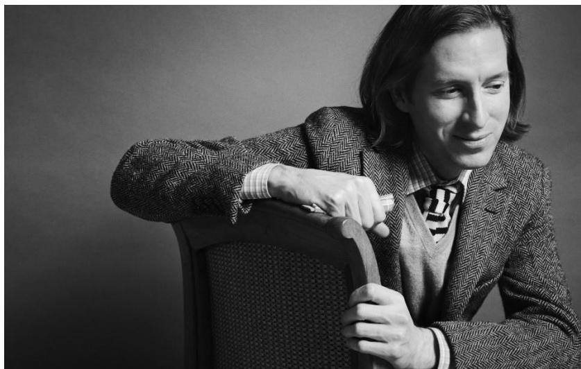
slika 1: Wes Anderson