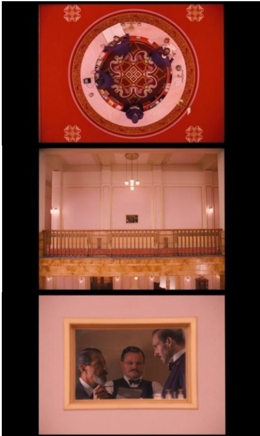
slika 32, 33 i 34: Kadar iz filma

I u ovom Andersonovom filmu možemo osjetiti njegovu sklonost prema centriranim i simetričnim kadrovima. Veliki broj kadrova simetrično je postavljen što se može vidjeti i iz prijašnjih primjera. Simetrija znači slika u ogledalu - jedna strana je zrcalna slika druge.