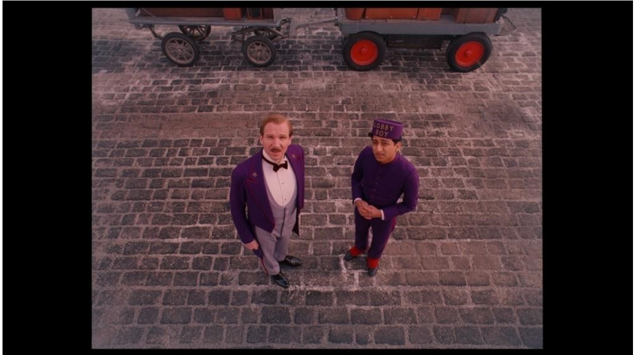
slika 31: Kadar iz filma

Više puta u filmu pojavit će se i kadrovi iz gornjeg i donjeg rakursa sa širokim objektivom. Stvaraju veoma specifičnu točku gledanja i u mnogo slučajeva takva pozicija kamere omogućuje puno prirodnije popunjavanje kadra u kvadratnom formatu slike (slika 31).