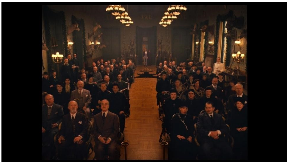
slika 11: Kadar iz filma

Još jedan karakterističan primjer za opis navedenog: Frenetični drugi čin u filmu počinje sa zlim blizancem Hotela Grand Budapest, već spomenutim dvorcem Lutz. Dok Grand Budapestovi topli tonovi i plišane teksture zrače otmjenim luksuzom, tamni i tvrdi ambijent dvorca Lutz naglašava opresivno bogatstvo. Njegovo središte je soba s trofejima (slika 11), u kojoj se čita oporuka Gustavove ljubavnice Madame D. Prostorija je natrpana prepariranim ustrijeljenim životinjama, i prepuna članova obitelji očiju uprtih prema izvršitelju oporuke Kovacsu, koji kao da čekaju izvlačenje brojeva na lutriji. Tragovi duboke, inače opuštajuće zelene, kao i zlatne boje po zidovima, ne mogu gledatelja osloboditi lošeg osjećaja da se nalazi u grobnici.