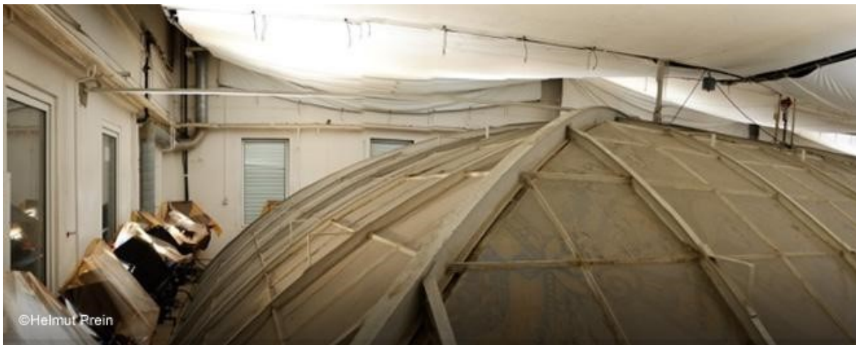
slika 39: Postava rasvjete

Rezultat je bio impresivan a istodobno i realističan.