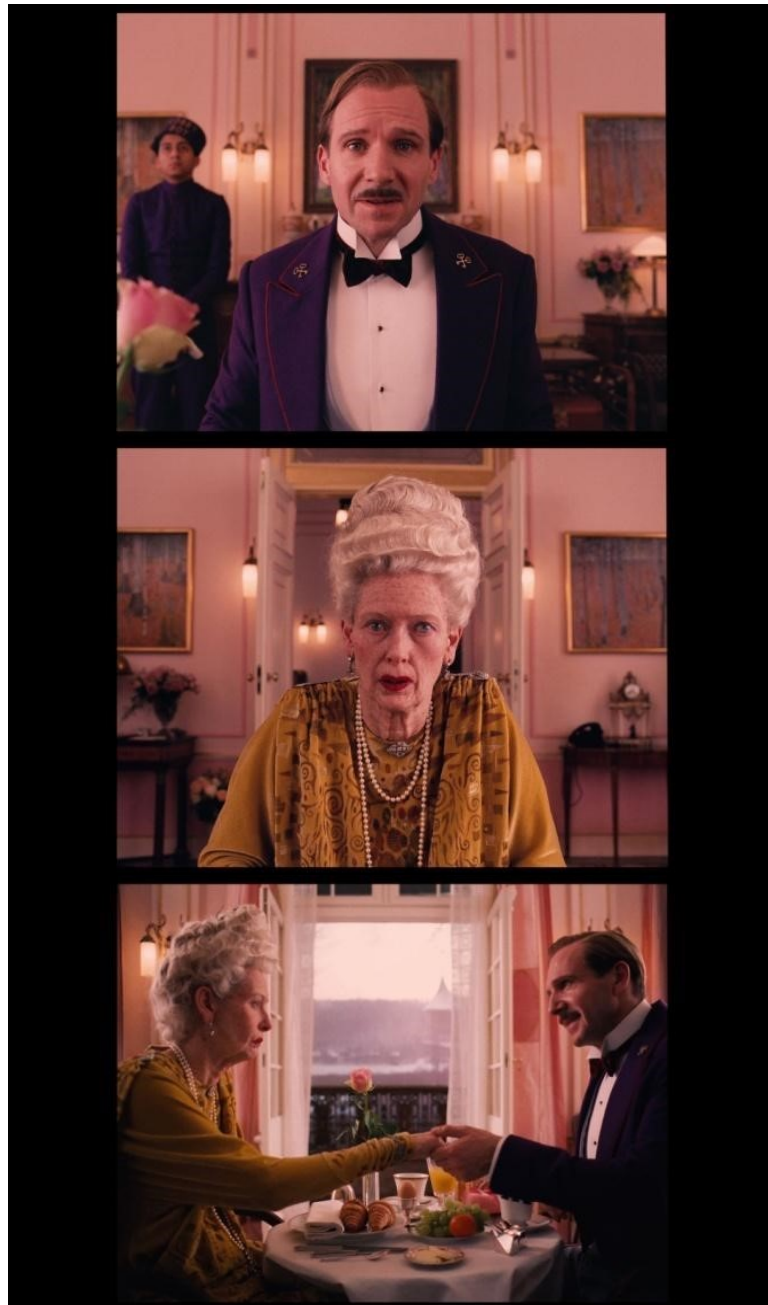
slika 23, 24 i 25: Kadrovi iz filma

Dijalog Madame D i Gustavea nakratko se nastavlja i u hotelskom liftu. Osim jarko crvene boje lifta, još je jedna stvar zanimljiva. Andersonova sklonost prema centriranju i simetriji teži prema širokoekranskim kompozicijama koje bi jednostavno mogle biti odrezane s lijeve i desne strane, tako da stanu u omjer 1.37:1. Pojedinačni likovi i zbijene grupe mogu jednostavno biti kadrirani kao i prije. Međutim, kod udaljenijih kadriranja postoji opasnost od dobivanja previše praznog prostora u gornjem i donjem dijelu kadra, koji ne postoji u npr. omjeru 1,85:1. Drugim riječima, Andersonova multi-formatna strategija zadala mu je novi izazov u održavanju svog