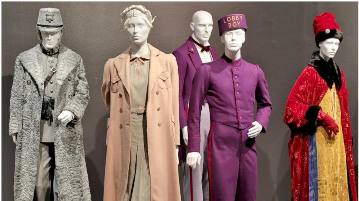
slika 13: Kostimi iz filma

Kada pričamo o filmskom izražaju u Hotelu Grand Budapest, još jedan aspekt uvelike pridonosi njegovoj ljepoti, a to su kostimi, bilo da je riječ o službenim hotelskim uniformama, robijaškim odorama, ali i odjeći drugih likova. Dobro pogođeni kostimi uvijek doprinose karakteru lika i vjernosti vremenskog razdoblja, a to je i ovdje slučaj. Puno je primjera da se pojedini film pamti upravo po kostimima: mnogobrojni povijesni filmovi starijeg datuma, ali i noviji filmovi svih žanrova: Amadeus , Hair , Clockwork orange , Indiana Jones , Chariots of fire , itd.