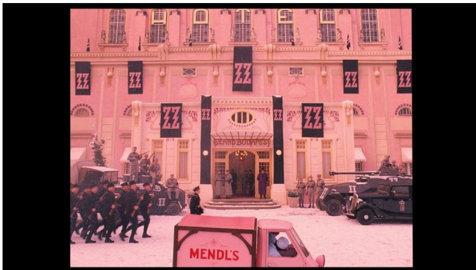
slika 3: Kadar iz filma

I povijesne i zemljopisne odrednice u filmu su nejasne, pa je sama priča smještena između fantastije i stvarnosti. Međutim, iako se film odvija u zamišljenoj prošlosti, on nije lišen poveznica sa stvarnim povijesnim zbivanjima i uključuje određeni politički kontekst. Primjerice, u filmu fašisti na vlasti nisu nacisti (slika 3), ali se gotovo sigurno može ustvrditi da je redatelj imao namjeru na taj način prikazati upravo njih.