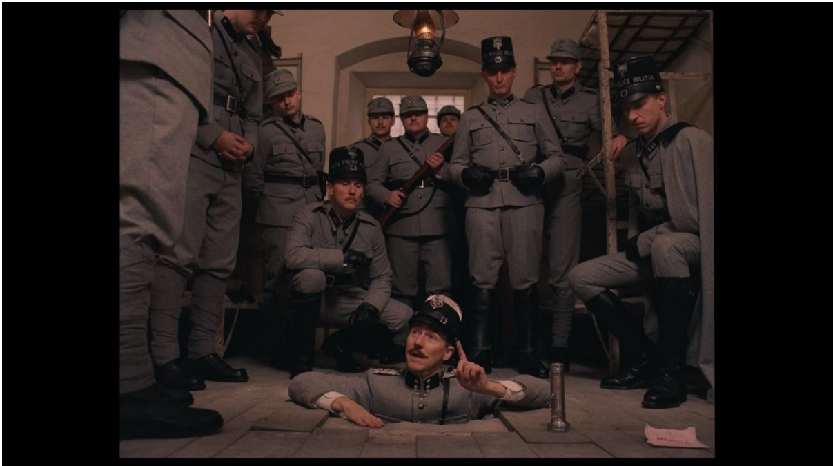
slika 35: Kadar iz filma

Velik je broj primjera u filmu gdje simetrija, kvadratni format, pa čak i dizajn samog seta uvelike pomažu u savršenom kadriranju. Poput scene u zatvoru gdje Henckels izvire iz rupe nakon što otkriva da su zatvorenici pobjegli. Da bi prikazao više ljudi u kadru, Anderson ih grupira po slojevima. Također, dodatni vertikalni prostor koristi na kreativan način. 1.37:1 format i niski rakurs kamere omogućio mu je da ih sve uključi u savršeno komponirani kadar. (slika 35)