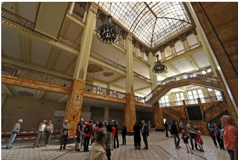
slika 7: Lobi robne kuće

Zatim, impresivni interijeri - stubišta, dizala, atrijski i sl. odmah su privukli pažnju scenografa Adama Stockhausena, koji ih smatrao idealnima zbog razmjera i grandioznosti. Stupovi, stepeništa i veliki luster bili su dostupni “u originalu”, dok su ostalo morali napraviti. Uvažavajući Andersonove zahtjeve scenografski tim uspio je transformirati interijer u različite faze hotela kojeg vidimo u filmu. Za scene u lobiju (slika 7) radili su dvostruki posao: jedna postava lobija je bila za period iz 1930-ih godina prošlog stoljeća (u vrijeme kad se i odvija većina filma), a druga za period 1960-ih godina, kada se hotel drastično promijenio nakon velikog rata i dolaska komunizma.