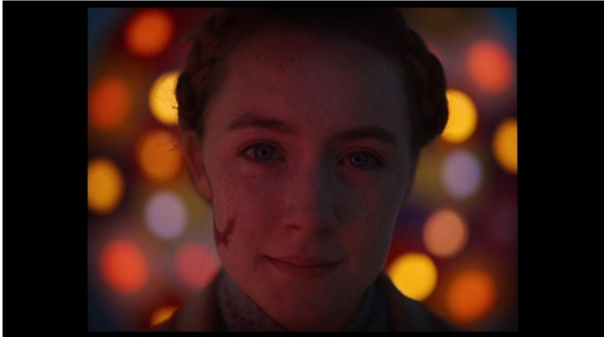
slika 27: Kadar iz filma

savršeno utjelovljuje ljubav (slika 27). Također u ovom kadru možemo vidjeti ljepotu formata 1.37:1 kada su u pitanju portreti.