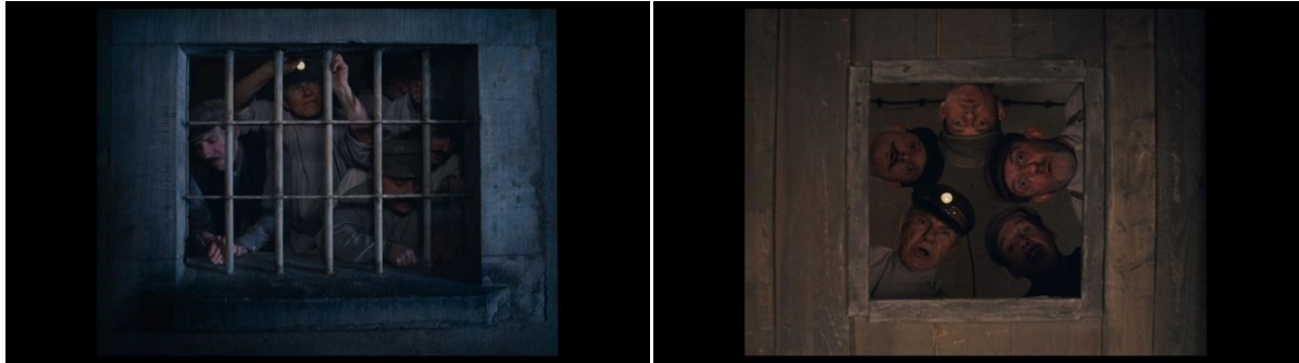
slika 36 i 37: Kadrovi iz filma

Često koristi vizualnu tehniku kadra u kadru. Dio scenografije postaje dodatni okvir, obično kvadratnog oblika poput formata filma omogućujući tako spretno simetrično kadriranje (slika 37 i 38).