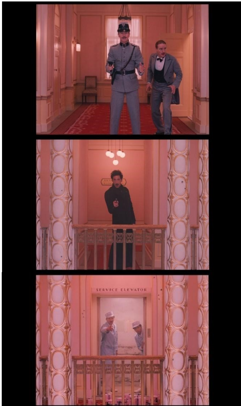
slika 28, 29 i 30: Kadrovi iz filma

centriranim vratima i hodnicima, kako bi se u kadru ulovili ljudi koji iz njih izlaze (slika 28, 29 i 30).