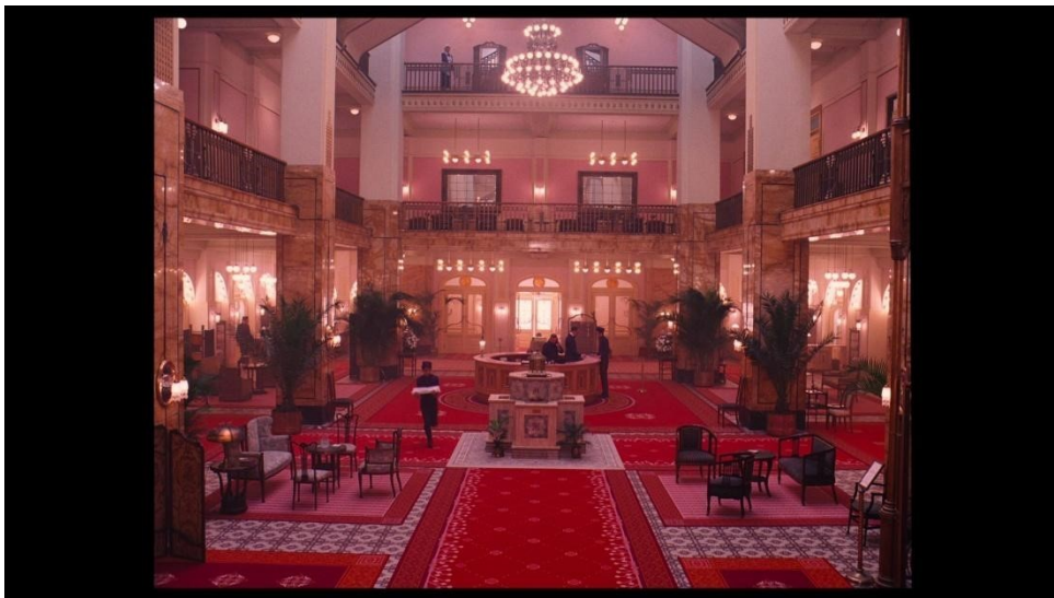
slika 10: Kadar iz filma

Kao što je već rečeno film je pedantno dizajniran, pri čemu su često korišteni šareni i kičasti ukraši. Anderson je uložio veliki napor da bi našao dobar omjer između stilizacije i realizma i taj balans filmu daje napetost. Osim toga takav “dualistički” pristup poslužio je za opis Europe u doba industrijalizacije, ali i nadolazećeg rata, kad kultivirani i gospodski gradovi poput Beča, Pariza, Londona i Berlina, postaju mjesta najtežih mogućih zločina.