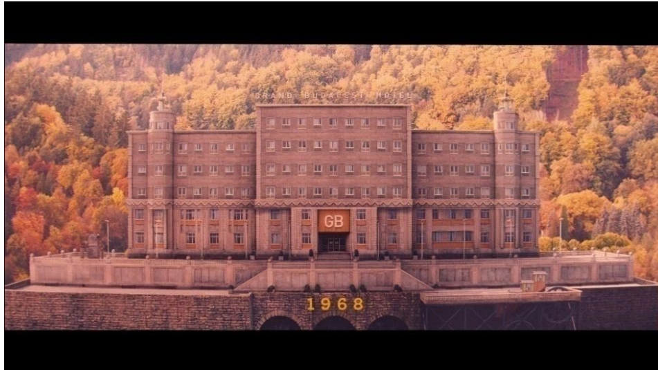
Slika 17: Kadar iz filma

U narednih nekoliko kadrova upoznajemo se s hotelom i ljudima koji obitavaju u njemu. Svi kadrovi su manje više statični i fiksni, uz pokoju iznimku preciznog panoramiranja pod 90 stupnjeva. U nekoliko kadrova možemo primjetiti čari cinemascope formata i anamorfotskih objektiva, posebice u simetričnim kadrovima u kojima se ravne linije deformiraju (distorzija 12 ) (slike 18 i 19).