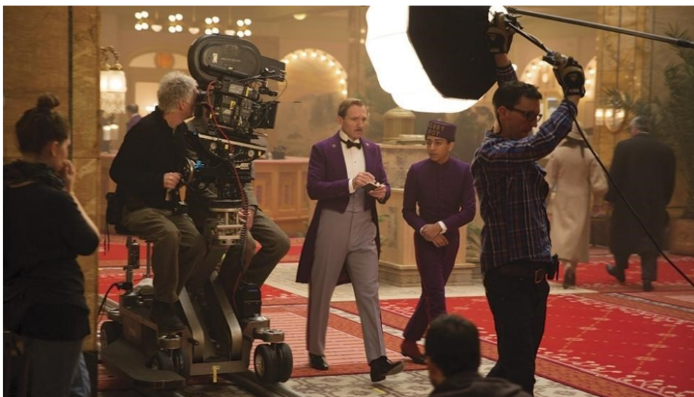
slika 38: Na setu filma

Kako kaže Yeoman, Anderson je redatelj koji ima vrlo konkretnu ideju i kada je u pitanju dizajn svjetla, te je odlučan da se izvede što je preciznije moguće. Yeoman i Anderson snimili su proteklih nekoliko godina sedam filmova zajedno, te su se u tom period dobro upoznali i izgradili međusobni odnos povjerenja. Otprilike 75% ovog filma snimljeno je u 1.37:1 omjeru slike, pa su često imali dijelove stropa i poda u kadru, te je bio izazov pronaći adekvatnu poziciju za rasvjetna tijela.