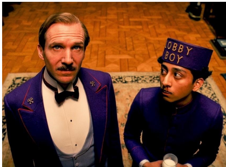
slika 9: Ralph Finnes kao Gustave i Toni Revolori kao Zero

Nesumnjivo, dva su središnja aktera priče – gospodin Gustave i njegov mladi pomoćnik, potručko Zero (slika 9). Anderson je od početka znao tko će glumiti Gustavea i tu je ulogu bez dileme, potpuno opravdano dodijelio Ralphu Fiennesu, koji se pokazao idealnim odabirom. Dobro je odglumio proturječnosti lika koji tumači: taštinu, nesigurnost, pedantnost, principijelnost. Vješto je balansirao između beskrupuloznog šefa i dobroćudnog prijatelja, a naročito je uživao u očinskom odnosu prema mladom štićeniku Zerou (odlično ga je prikazao debitant Toni Revolori) koji je ustvari pravi nosilac filma.