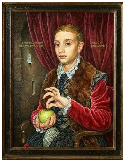
slika 8: Dječak s jabukom

Slika oko koje nastaje zaplet filma - Dječak s jabukom , renesansnog umjetnika Johannesa Van Hoytla mlađeg, ustvari je fiktivna slika (slika 8) koju je naručio Anderson i naslikao Michael Taylor, a bila su potrebna puna četiri mjeseca da bi se pripremila za film !