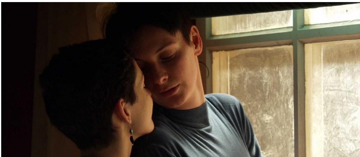
Slika 4.2.: Prikaz toplih boja prošlosti u filmu Fine mrtve djevojke