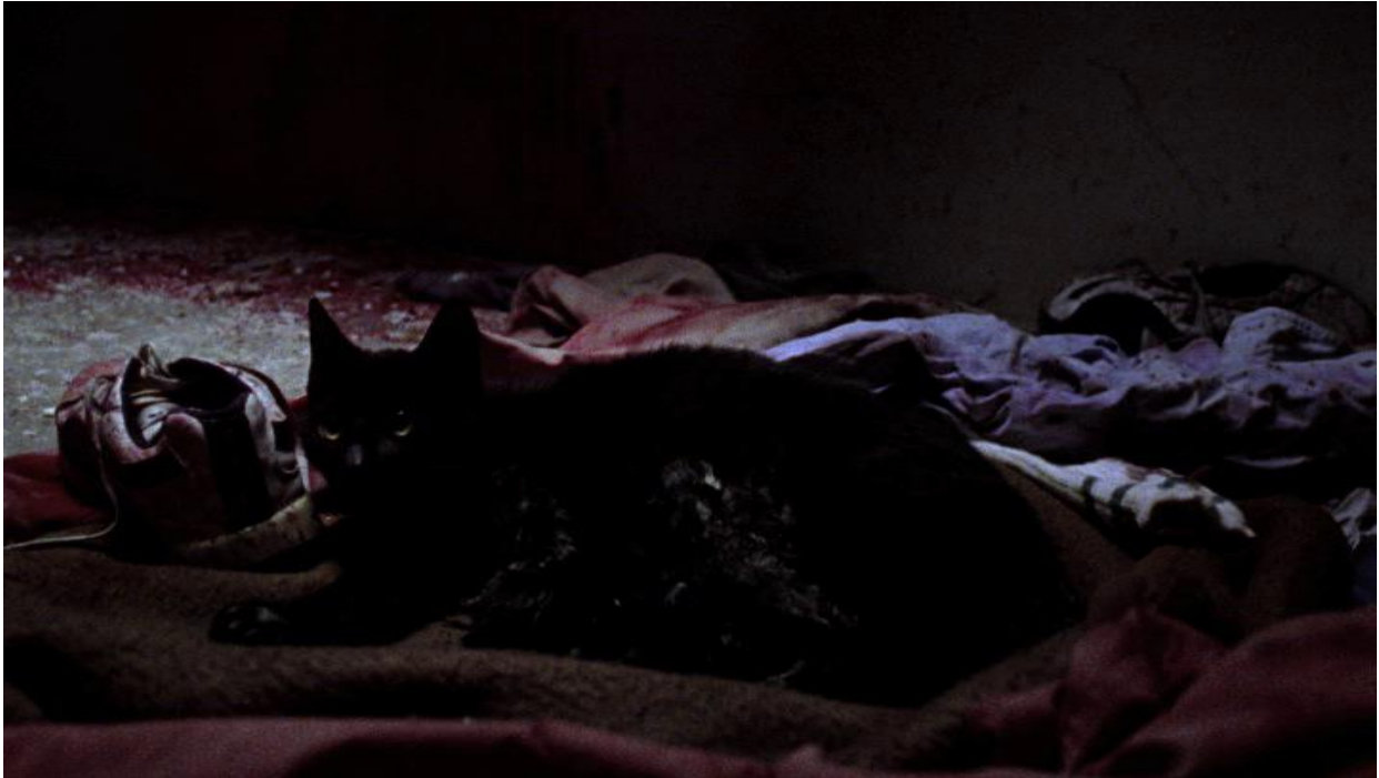
Slika 1: Prikaz poroda crne mačke u filmu Crnci

nam odmah poručuju da se radi o mračnom filmu, bez previše uljepšavanja i poruka nade. Crnci su hladan i odmjeren žanrovski prikaz zločina počinjenog u Domovinskom ratu.