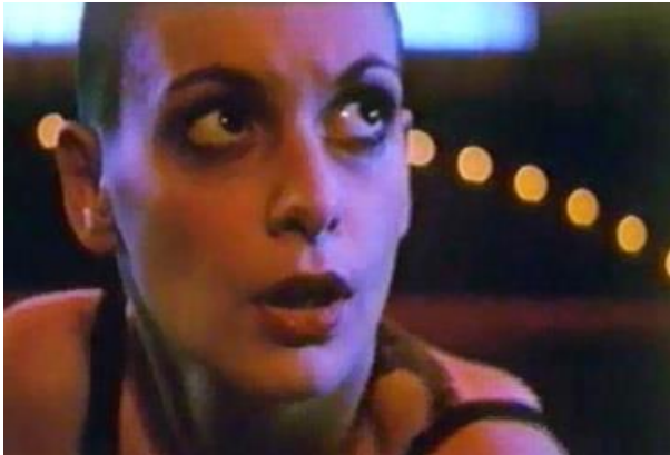
Slika 3.1.: Prikaz kolorita u filmu Rusko meso