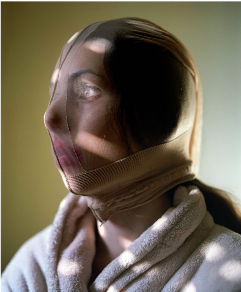
( https://vizkultura.hr/wp-content/uploads/2018/02/Lizde_31.jpg )