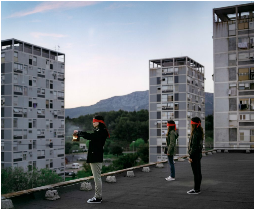
( https://vizkultura.hr/wp-content/uploads/2018/02/Lizde_05.jpg )

Upravo je to polazišna točka promišljanja umjetnice Glorije Lizde, postavljajući si pitanje je li moguće retrogradno preispitati teške, potisnute i nezabilježene odsječke vremena jedne obitelji. No prije poniranja u minule trenutke, autorica vrši opsežno istraživanje očeve bolesti, koja je obilježila odrastanje njegovih triju kćeri, poznate pod hladnim medicinskim kodom F20.5 za rezidualnu shizofreniju. Zatim postavlja te iste tri protagonistkinje u inscenirane reinterpretacije očevih halucinacija, koje poprimajući performativni karakter terapijski djeluju na mjesta potisnute obiteljske memorije. Pritom umjetnica koristi kapacitet fotografije za resemantizaciju istanjenih sjećanja, a završenu seriju dijeli na tri segmenta: unificirane portrete triju sestara te izvedbe očevih halucinacija koje se isprepliću s prikazima mrtve prirode. Na taj način proširuje priču o očevim unutarnjim antagonizmima kroz druge članove obitelji, koji su njima predodređeni, sintetizirajući istovremeno više pogleda na "jednu stvarnost".