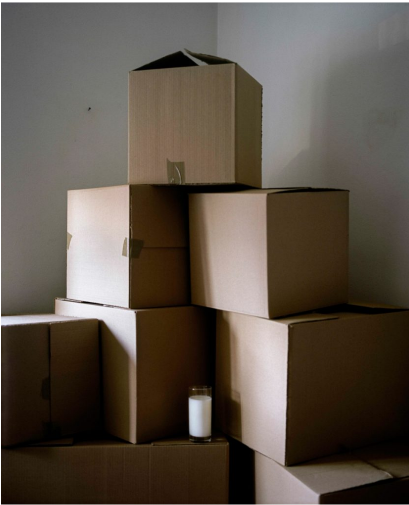
( https://vizkultura.hr/wp-content/uploads/2018/02/Lizde_24.jpg )