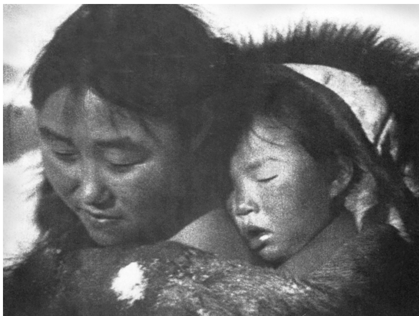
Slika 2 Kadar iz filma Nanook of the North, Robert J. Flaherty (1922.) 3

istraživanje života Eskima na Antarktiku postavilo je temelje za budući razvoj dokumentaraca. 2 Njegovi filmovi temeljili su se na izuzetno slikovnom prikazu odnosa između čovjeka i prirode.