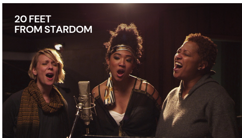
Slika 4 - Plakat filma Pet metara do slave , redatelja Morgan Nevillea (2013.) 9

Slika 2.1. Slika iz filma „Pet metara od slave“, redatelja Morgan Nevillea (2013). Kako Nicholson navodi, film je 2013. godine nominiran za nagradu Oscar te je iste godine i osvojio istoimenu nagradu za najbolji dokumentarni film.